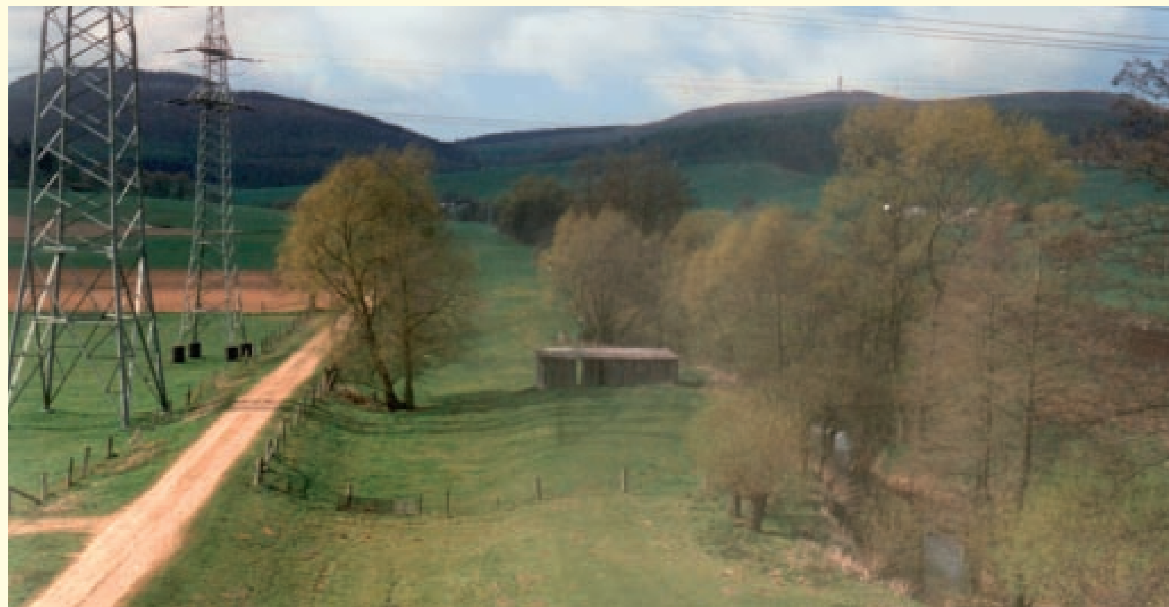
Heute ist an Stelle des Landgraf-Carl-Kanals nur eine Senke zu erkennen. Rechts daneben fließt die Esse.

Die Esse, an deren Einmündung in die Diemel 1722 der Ausbau des eigentlichen Kanalabschnitts begann, war stark hochwassergefährdet. Deshalb wurde der Kanal neben der Esse gebaut, so dass das Hochwasser nicht über den Kanal abgeführt werden musste. Deutlich ist heute noch die Senke zu erkennen, in der der Kanal entlangführte und die nach Einstellung der Schifffahrt und nach dem Anlegen von Dämmen teilweise für die Fischzucht verwendet wurde.